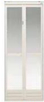
(ホワイト) W650×H1800mm W750×H1900mm