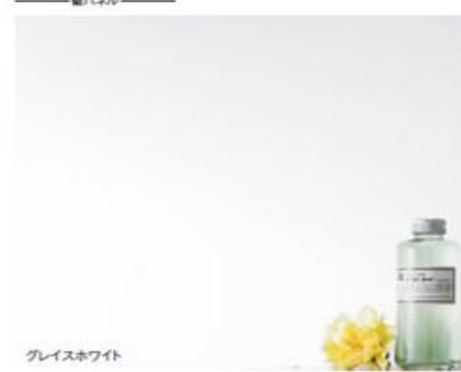
グレースホワイト