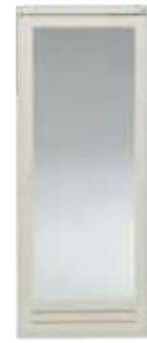
(ホワイト) W650×H1800mm W750×H1900mm